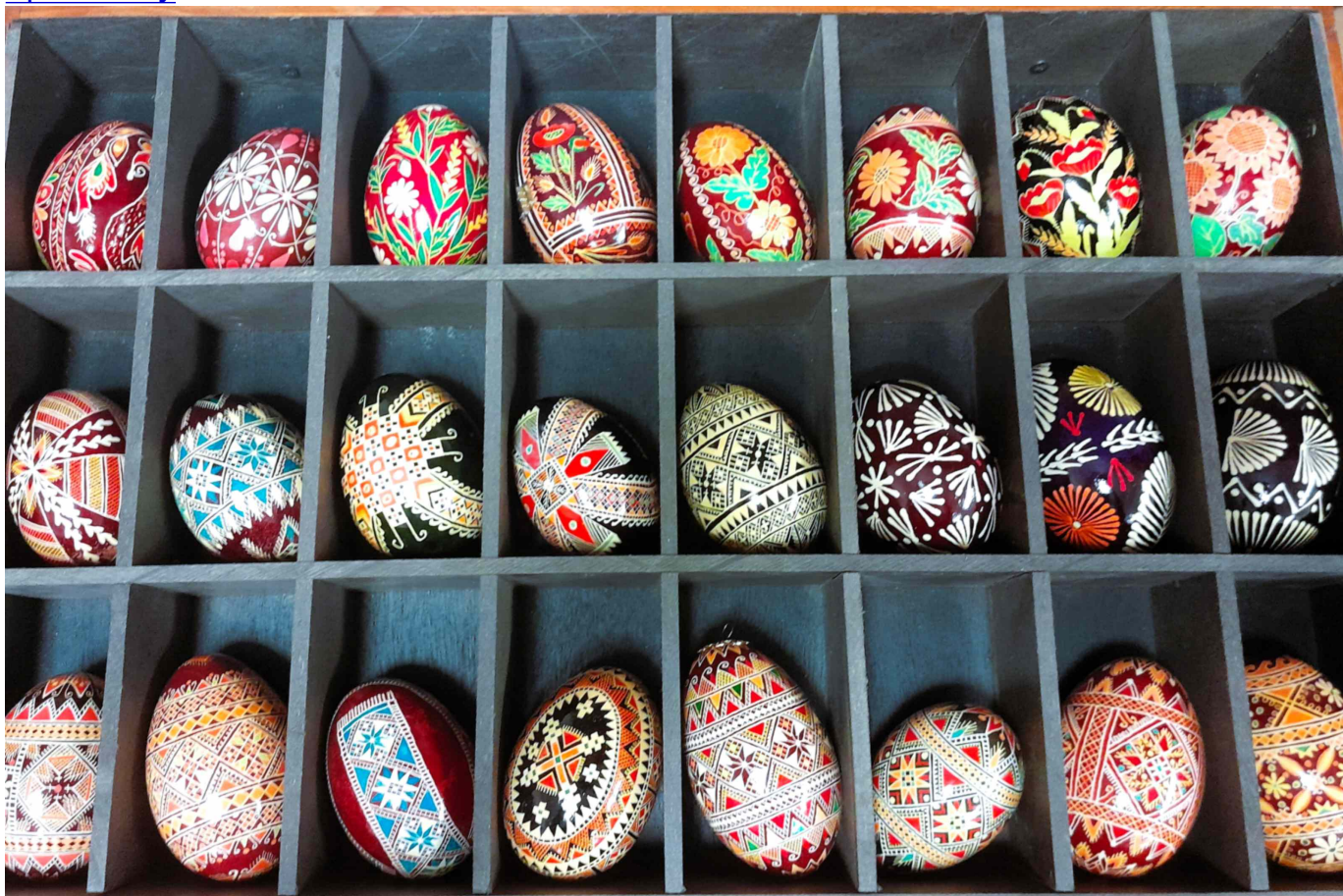
Colección de pysanky ucranianos en la Sala de Legado Basiliana.