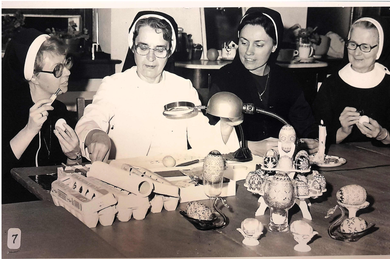
Hermanas decoran huevos al estilo ucraniano.